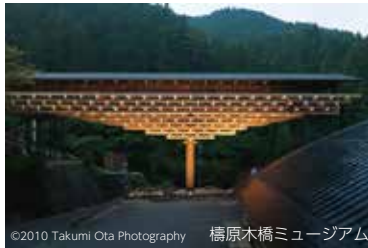
橋原木橋ミュージアム