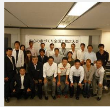
笑顔の家作り応援隊の協力体制

・家が完成するまでには数多くの業者さんが関わってきます。その多くの業者さんを福島に拠点を置く業者さんを中心としたグループネットワークを構築することにより、よりスピーディーな対応を可能とすることができました。しかし、さらに多くの情報を取り入れる必要性もあることから、県外の企業や工務店との定期的な勉強会を開催し、情報の交換を行っております。