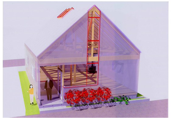
スケルトンを透かす